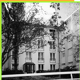
Le siège de L'Association Le Relais Ozanam