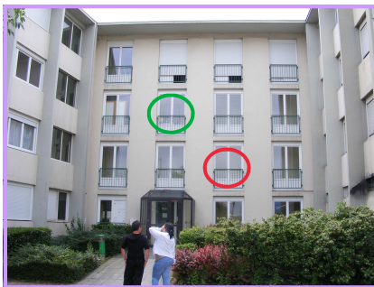
Siège de l'association, et 6 Appartements pour l'Hébergement Temporaire PAO

L'augmentation du nombre de sorties, la baisse de la durée de séjour et la diversité des solutions trouvées après leurs séjours (cf. page 4) démontrent l'adaptation de ce dispositif au contexte de la situation grenobloise et à celle des besoins des ménages.