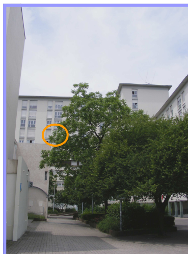
Un des appartements du Logis

Ce rapport 2012, nous donne les informations concernant le profil des publics accueillis et qui ont pu se mettre à l'abri, le temps de faire leurs démarches et de retrouver une solution d'habitat qui leur convienne.